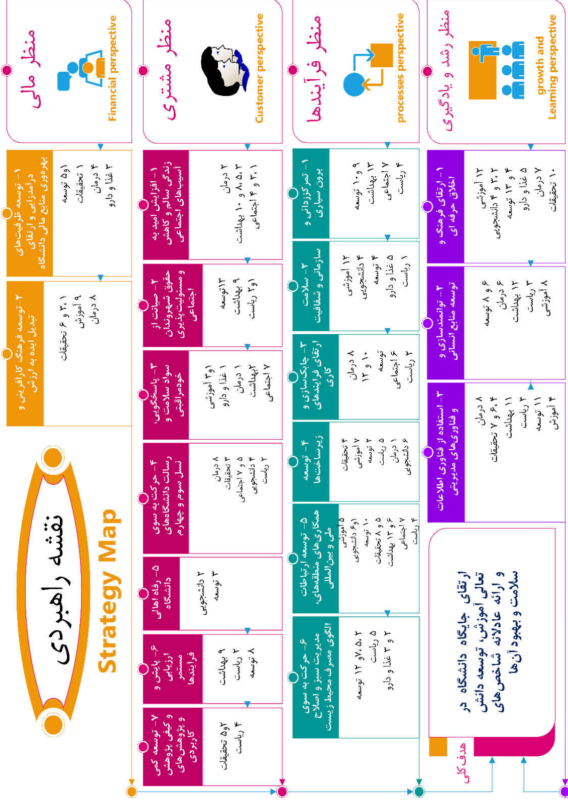
شکل (۱۵-۱) دورنما و نقشه راهبردی دانشگاه علوم پزشکی کردستان تا افق ۱۴۰۱