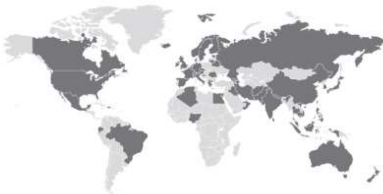
نقشه جهانی موارد کووید-۱۹ تأیید شده (۲۷ فوریه ۲۰۲۰)

مواردی از بیماری کووید-۱۹ در مسافران وارد شده به ایالت متحده مشاهده شده است. همچنین انتقال از انسان به انسان بین مخاطبین نزدیک این مسافران بازگشته از ووهان گزارش شده است. در ۲۵ فوریه، CDC مواردی از بیماری کووید-۱۹ را در فردی که بنا به گزارشها سابقه مسافرت یا مواجهه با بیمار مبتلا به کووید-۱۹ نداشت، تأیید کرد. در حال حاضر، این ویروس در جوامع ایالات متحده شیوع ندارد.